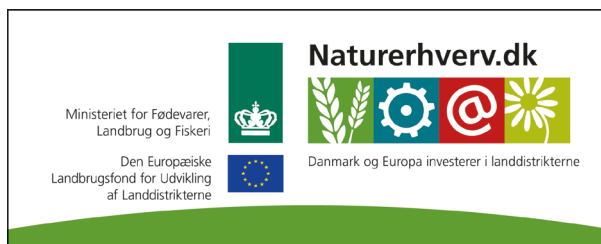
Se 'European Agricultural Fund for Rural Development' (EAFRD)